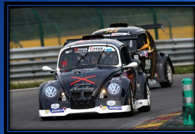
Jacky Ickx & Tom Boonen