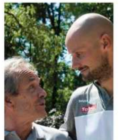
Deux mentors sacrés à Francorchamps.